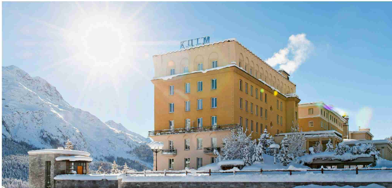
Weltberühmter Alpenpalast: Das Kulm Hotel in St. Moritz ist das beste Winterhotel der Schweiz mit fünf Sternen