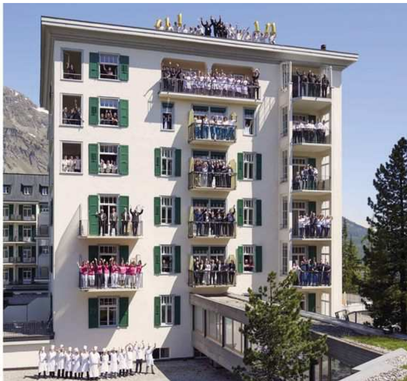
Das Sommer-Team 2019 im «Waldhaus» in Sils-Maria. Das Sommer-Team 2019 im «Waldhaus» in Sils-Maria.

Am 15. Juni 1908 begrüßte das Waldhauses Sils seine ersten Gäste. Das ist genau 111 Jahre her. Inzwischen wird das weltweit bekannte Hotel in 5. Generation der Inhabersfamilie geführt.