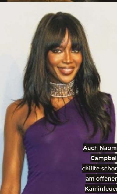
Auch Naomi Campbell chillte schon am offenen Kaminfeuer

Auf einem Sonnenplateau in knapp 1400 Meter Höhe thront das nagelneue „Silena“. Die jungen Gastgeber-Geschwister setzen auf einen inspirierenden Mix aus Südtiroler Tradition und asiatischem Feng Shui – ob im Design, beim Essen, dem Lese- und Denkstoff in der Bibliothek-Lounge oder im Spa. Neben Massagen mit heißen Moorstempeln oder Granitsteinen sowie kostenlosen Yoga- und Qi-Gong-Kursen sollte man unbedingt die Sauna besuchen: Hier kann man bei Kräuteraufgüssen auch literarische Kurzlesungen genießen. silena.com