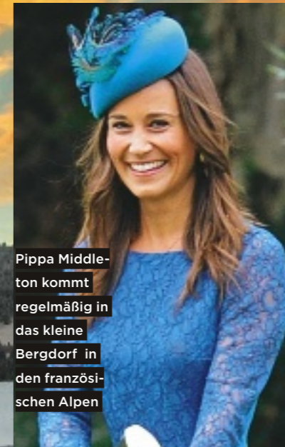
Pippa Middleton kommt regelmäßig in das kleine Bergdorf in den französischen Alpen