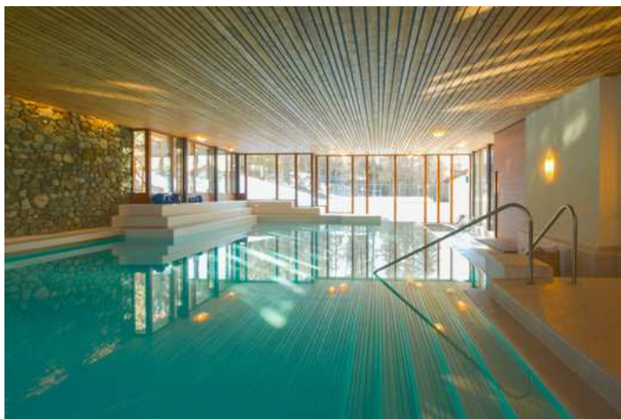
Le spa: le Waldhaus s'est adapté à sa clientèle avec un circuit bien-être de 1400 mètres carrés. Arnaud Delalande

Si la distinction attribuée par le portail de réservation Holidaycheck a réjoui les frères Dietrich et leur équipe, ils restent modestes. «Nous n'avons pas sauté au plafond. Ils sont d'ailleurs trop hauts. Et n'est pas non plus une raison d'affirmer: «Nous sommes les meilleurs!» Disons que l'on ne peut pas dire que l'on fait tout faux. Ici, la situation géographique est magique.» Le jeune père de famille concède tout de même: «C'est une bonne nouvelle, agréable à lire dans les journaux.»