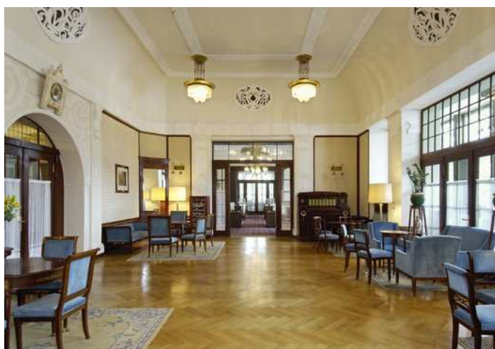
Le charme Art déco du salon bleu. Ralph Feiner

«Ici, le temps suspend son vol», pourrait clamer le poète. Calme, nature et déconnexion, c'est bien ce que viennent chercher les clients dans ce fameux établissement qui a servi de décor aux films «Rien ne va plus» (1997) de Claude Chabrol et «Sils Maria» d'Olivier Assayas (2014). Il vient d'être consacré meilleur hôtel de Suisse par le million d'utilisateurs de la plateforme Holidaycheck qui, depuis six ans, publie, en début d'année, le rating des 10 meilleurs hôtels de 35 pays.