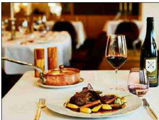
«Dine Lightly»: Eine Menü-Variante für Singles im «Bellevue», Adelboden.

Trotz aller Vorteile eines Single-Room-Angebots: Gespalten bleibt das Verhältnis der Hoteliers zu einem solchen. Die eingeschränkte Flexibilität im Buchungsablauf und der internationale Doppelzimmer-Standard sind Hauptgründe. Im Hotel Kronenhof in Pontresina praktiziert man einen Kompromiss: Ein Teil der Einzelzimmer ist über eine Türe miteinander verbunden. Gerade Paare, die getrennt schlafen möchten, schätzen diese Möglichkeit, so Hoteldirektor Marc Eichenberger. «Auf die Einzelzimmer will ich auf keinen Fall verzichten.» Auch internationale Hotelketten setzen wieder bewusst auf Einzelzimmer, wie Mövenpick in ihrem Hotel in Zürich-Regensdorf mit seinen neuen «Sleep-Zimmern» (Reportage Seite 17).