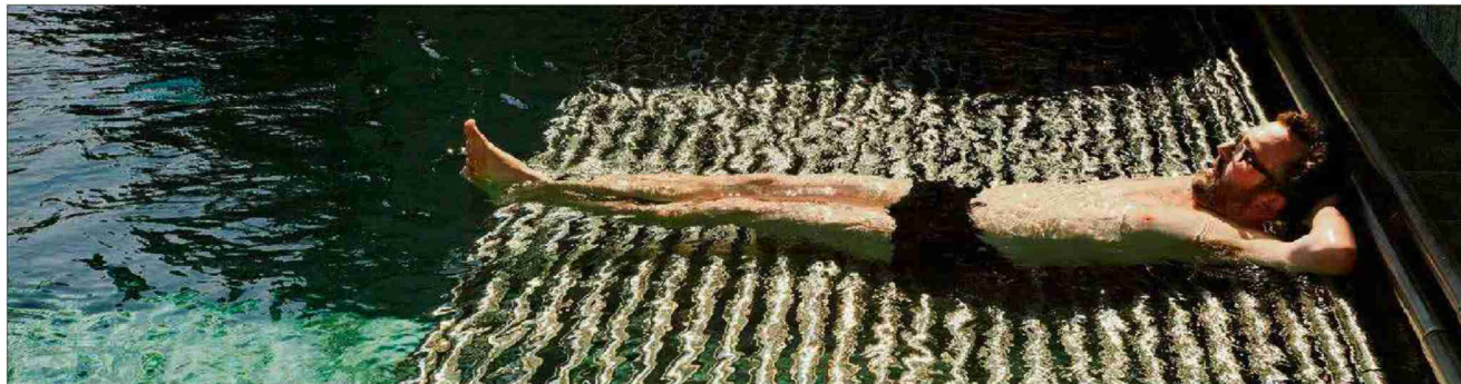
Die Infrastruktur eines Hauses ist für den Alleinreisenden zentral. Der Singlegast hält sich gern im öffentlichen Raum auf – er will sich nicht einsam fühlen.