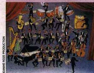
Piccolo, Saxo et Compagnie au Théâtre des Champs-Élysées