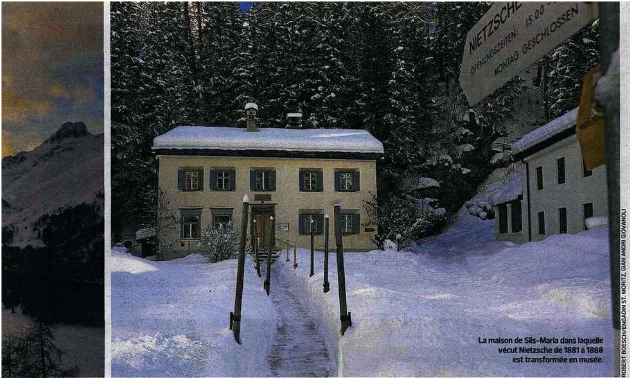
La maison de Sils-Maria dans laquelle vécut Nietzsche de 1881 à 1888 est transformée en musée.