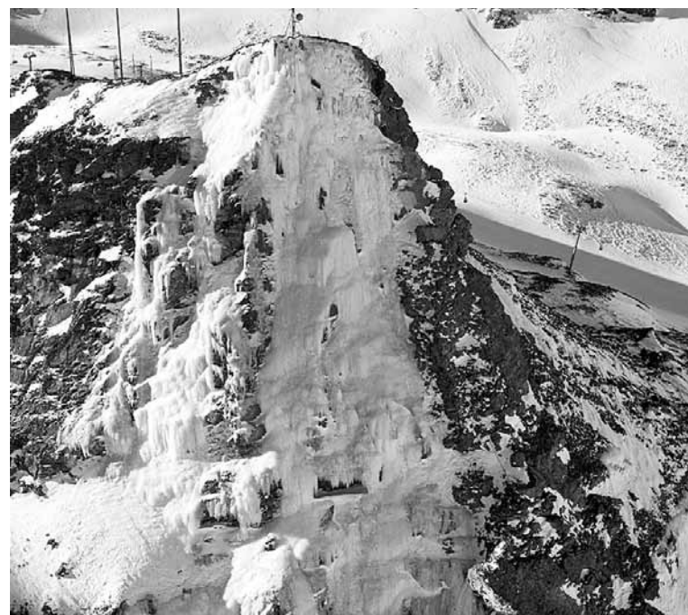
Der vereiste Corn da Diavolezza.

Die Workshops am Sonntag, 28. März, sind offen für alle, die zum ersten Mal Eisklettern ausprobieren möchten oder sich neue Tricks von einigen der weltbesten Eiskletter-Athleten anschauen wollen. Die Top-Cracks Ines Papert, Albert Leichtfried, Markus Bandler sowie Jack und Petra Müller zeigen in kleinen Gruppen ihre Tipps und Tricks in abgesicherter Umgebung mit Bergführern. Eiskletter-Ausrüstung steht den ganzen Tag zum Ausleihen und Testen zur Verfügung. Bei schlechtem Wetter finden Wettkampf und Workshops an der neuen Drytooling-Anlage beim Sportpavillon in Pontresina statt. Am Samstagabend nach dem Wettkampf steigt eine Eisparty im Sportpavillon mit Pastaplausch, Filmen, Livemusik und Drytooling-Show. Weitere Informationen zum Programm sowie Anmeldungen für die Workshops und den Wettkampf gibt es unter www.Ready2Climb.com